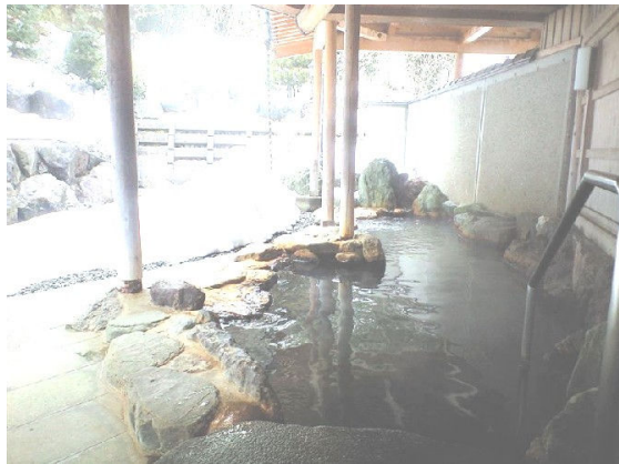
いけもりの大露天風呂

露天風呂が自慢です。宴会の前に雪見風呂をじっくりと楽しみました。来年には金屋本町も合流して、更に大きな新年会になると予想されます。