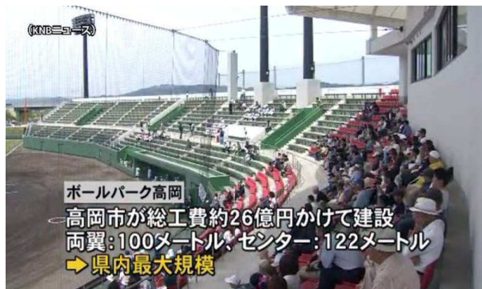
ボールパーク高岡 高岡市が総工費約26億円かけて建設 両翼:100メートル、センター:122メートル →県内最大規模

8月17～25日に高岡市の高岡西部総合公園野球場(ボールパーク高岡)を主会場に第26回世界少年野球大会富山大会が開催されます。