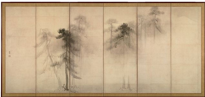
長谷川等伯 松林図

(注＝長谷川等伯：桃山時代に活躍した七尾市出身の絵師。狩野派に対抗し、長谷川派を率いて活躍した)